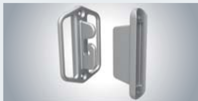
Trekgreep en handvathouder detailaanzicht

aangebracht. Als alternatief staat een steek- of schroefmast ter beschikking, die op de terrasvloer resp. in een betonbed kan worden bevestigd.