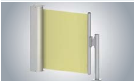
Paravento met schroefmast

Deze is met een van de kopplaten via een vierkante opening verbonden.