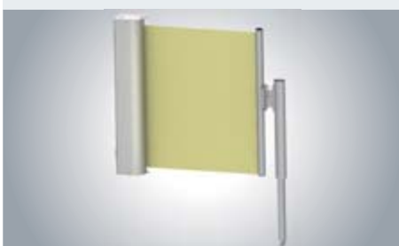
Paravento met steekmast

De schroefmast kan op de vloer worden vastgeschroefd, de steekmast kan in beton worden geplaatst.