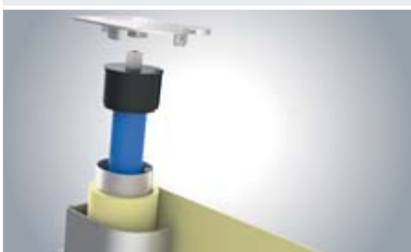
Doekspanning door veeras