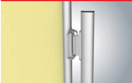
Trekgreep en ingehangen handvathouder