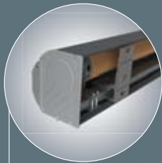
I 2000 zonder achterwand