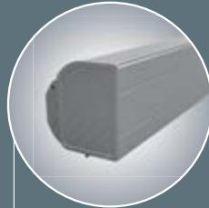
K 2000 met achterwand