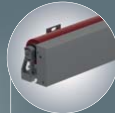
N 2000 voor nissen