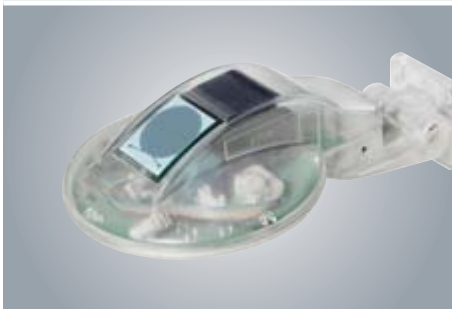
BiSens SWR-230 V